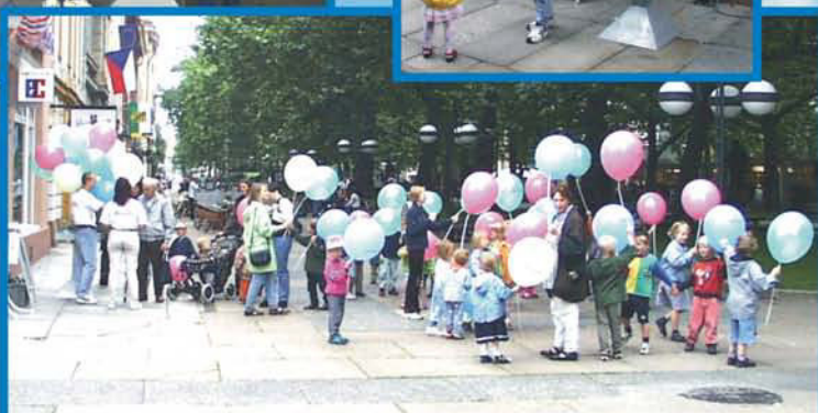
Verteilung von Pendelstabballoon