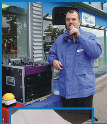
Infotainment im passenden Out fit